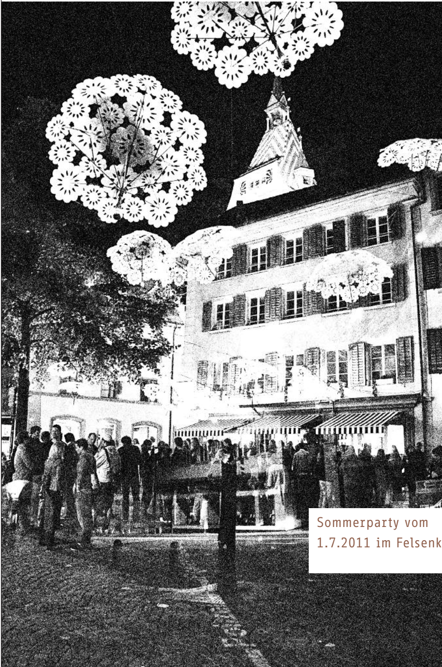
Sommerparty vom 1.7.2011 im Felsenkeller.

Beleuchtung: www.eigenbrot.ch